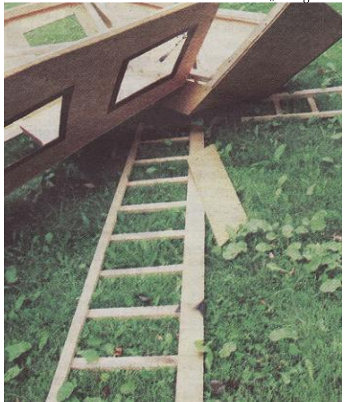
Įspūdingas ir nepakartojamas ugnies šou virto tikra atrakcija, nes buvo padegta ne šiaurinė skulptūra, bet greta stovėjęs malūnas.