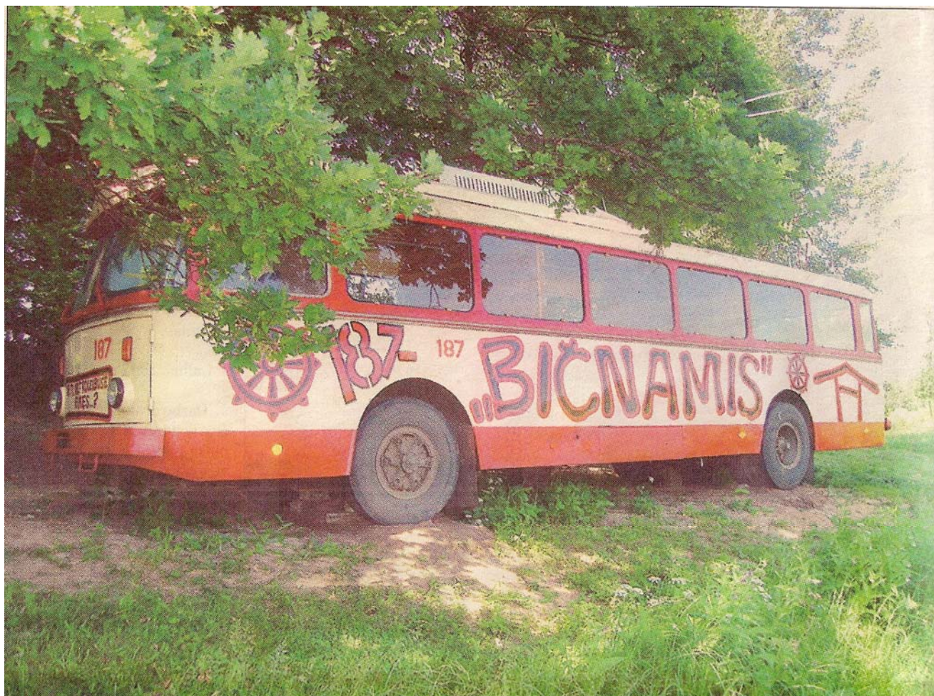
A. Danieliui „Bičnamis“ ant ratų atsiejo 10 tūkst. litų.