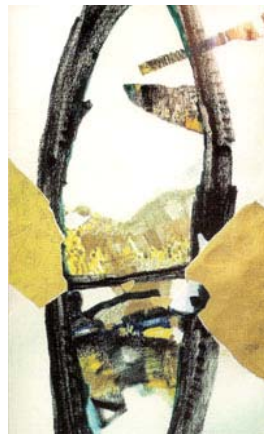
Lolita Rūgytė, „Diena“, 2000 Popierius, mišri technika, 89 x 52