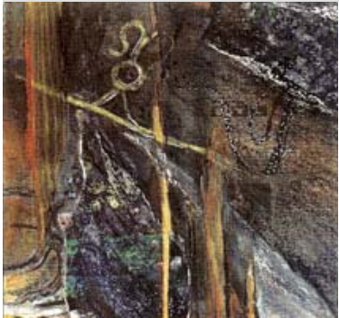
Ingrida Aukštikalnytė, „Gimimas“, 2000 Popierius, mišri technika, 30 x 32