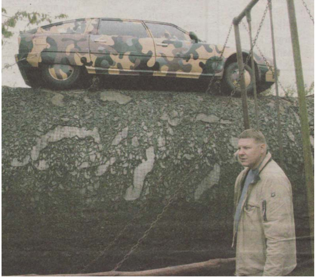
Iš išorės buvęs degalų rezervuaras atrodo kaip užmaskuota slėptuvė...