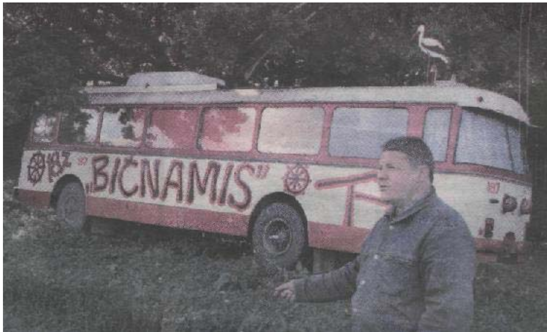
„Lietuvoje registruota daugiau kaip 500 kaimo turizmo sodybų, tačiau nė vienoje nerasi troleibuso, kuriame įrengti miegamieji kambariai“, – sakė verslininkas.

Verslininkas sako, jog šiandien kaimo sodyboje neužtenka vien pirties, kuri prieš dešimtmetį buvo gan stiprus traukos taškas. Reikia nuolat sukti galvą, kaip sudominti klientą, pasiūlyti jam tokias paslaugas, kurių jis negauna kitose kaimo sodybose. Dėl to vieni verslininkai siūlo dažasvydžio, kiti – keturračių motociklų nuomos paslaugas. „Lietuvoje registruota daugiau kaip 500 kaimo turizmo sodybų, tačiau nė vienoje nerasi troleibuso, kuriame įrengti miegamieji kambariai“, – juokavo pašnekovas. A. Danieliaus „Bičnamis“ iš kitų kaimo sodybų išsiskiria ir tuo, kad šeimininkas stengiasi išlaikyti natūralų gamtos prieglobstį ir jį derina su patogumu. „Čia idealios tvarkos ir švaros jūs nerasite – geriant kavą, šalia gali nukristi lapas ar gilė. Aš į poilsiavietę atvykstantiems žmonėms siūlau kultūringą, paprastą ir ramų poilsį ažuolų paunksmėje, kur jie gali patogiai jaustis“, – sakė pašnekovas, pridurdamas, kad „Bičnamyje“ ne vieta tiems, kam reikia sterilios aplinkos ir blizgesio. Verslininkas prisimena vieną reiklį poniją, kuri iškėlė sceną dėl lauke ant sienos besiplaikstančio voratinklio. „Suprantu jos priekaištus, tačiau ši sodyba yra tarp medžių,